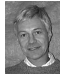
Af Peter Abrahamson. København Universitet

De sociale forhold der hersker i Kina i dag er i høj grad afhængige af politiske beslutninger, som blev truffet i 1978. Det år vedtog man indførelsen af to afgørende politikker: Den åbne dørs politik og etbarnspolitikken. Den første satte den kinesiske økonomi på kapitalistiske skinner, og har medført en uovertruffen økonomisk vækst. Som nævnt i en tidligere klumme (Social Politik 5, 2010) så er det de sociale konsekvenser af denne enorme økonomiske vækst, der har betydet at FN kan forvente at leve op til sin årtusindmålsætning om at halvere fattigdommen inden 2015 sammenlignet med situationen i 1990. Således faldt fattigdommen i Kina fra at vedrøre 80 procent af befolkningen i 1981 til nu at omfatte knap 18 procent. På en måde har etbarnspolitikken haft en tilsvarende positiv indflydelse på forbedring af de sociale forhold i Kina, idet den jo har betydet en omfattende reduktion i befolkningstilvæksten og har reduceret familiernes størrelse tilsvarende. Sammenlignet med andre lande i Syd som har fortsat en stor befolkningstil-